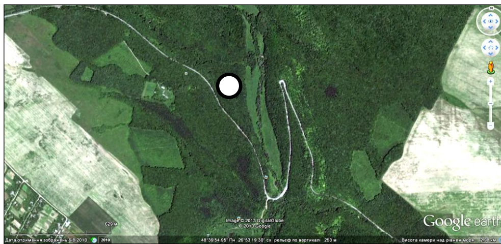
Рис. 1. Схема розташування пробної площі в ландшафтно-ботанічному заказнику «Совий яр» (кружком позначено місце розміщення пасток).

При аналізі структури домінування до видів еудомінантів ( ED ) відносили тих, частка яких від загальної кількості зібраних особин перевищувала 10 %, домінантів ( D ) — складала 5,1–10,0 %, субдомінантів ( SD ) — 1,1–5,0 %, рецедентів ( R ) — 0,51–1,00 % і субрецедентів ( SR ) — менше 0,5 %.